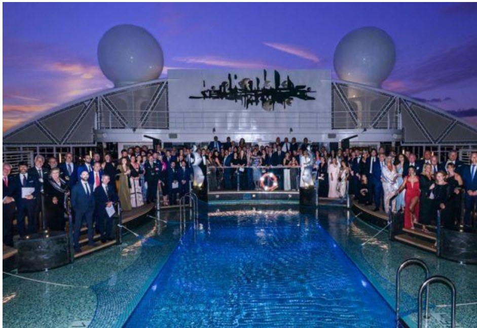
Foto di gruppo EssereUca

Una settimana all'insegna del divertimento e dello spirito di gruppo, per EssereUca sempre, tutti insieme.